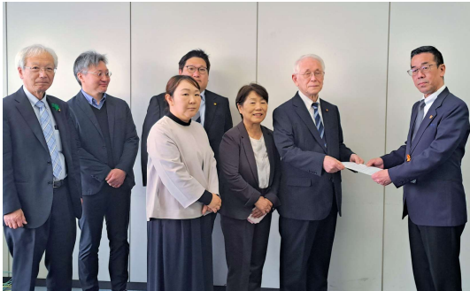
教育部長（右）に申し入れる党市議団